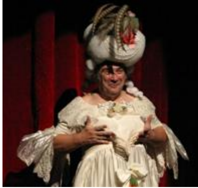
La Marquise s'adressant au public

Quelque temps plus tard, la troupe arrivait en notre Château des Bruyères. Elle fut accueillie fort civilement par mon coquin de mari. Zerbine fut fidèle, comme toujours, à elle-même. Quand au baron de Sigognac, Blazius entreprit de le policer.. Ca promet !